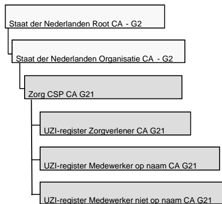
Figuur 2 CA-model SHA-2 generatie (G21)

De einddatum van de SHA-2 (G21) hiërarchie is 22 maart 2020. Deze hiërarchie maakt gebruik van een cryptografisch algoritme SHA-2 bij ondertekening van certificaten en CRL's. Deze structuur is weergegeven in Figuur 2 CA-model SHA-2 generatie (G21)